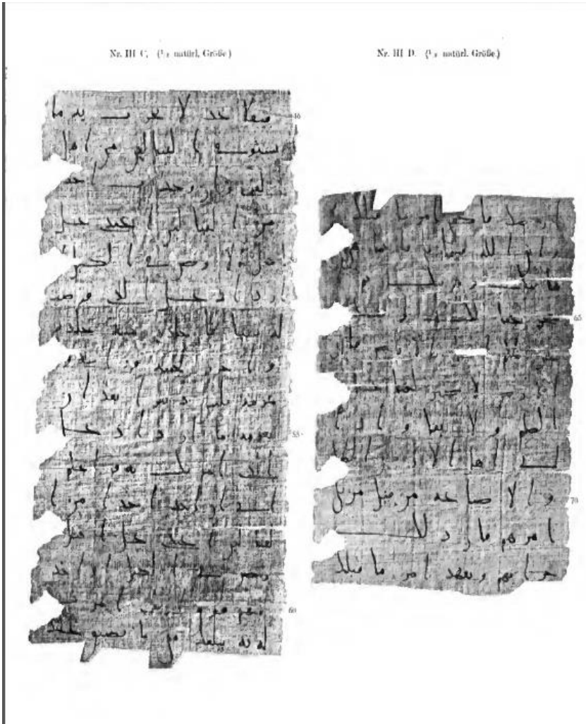
Carl Heinrich Becker: Papyri Schott – Reinhardt ( I ) , Heidelberg.1906 P.124